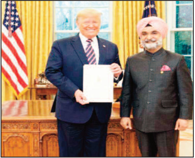
ਭਾਰਤੀ ਅੰਬੈਸਡਰ ਤਰਨਜੀਤ ਸਿੰਘ ਸੰਧੂ ਵਲੋਂ ਅੰਬੈਸਡਰ ਹਾਊਸ ਤੇ 'ਸਵਾਗਤੀ ਜੀ ਆਇਆਂ ਮਿਲਣੀ' ਦਾ ਆਯੋਜਨ। (ਰਿਪੋਰਟ ਅਤੇ ਤਸਵੀਰਾਂ ਦੇਖੋ ਸਫ਼ਾ 9 'ਤੇ)

ਘਰ-ਘਰ ਮੁਹਿੰਮ, ਰਾਸ਼ਟਰੀ ਸੁਰੱਖਿਆ ਅਤੇ ਸ਼ਾਹੀਨ ਬਾਗ ਦੇ ਮੁੱਦੇ ਦੇ ਬਾਵਜੂਦ ਭਾਜਪਾ ਦਿੱਲੀ ਵਿਧਾਨ ਸਭਾ ਚੋਣਾਂ 'ਚ ਦੋ ਅੰਕਾਂ ਤਕ ਨਹੀਂ ਪਹੁੰਚ ਸਕੀ। ਇਹ ਪ੍ਰਦਰਸ਼ਨ ਭਾਜਪਾ ਲਈ ਡੂੰਘੇ ਮੰਥਨ ਦਾ ਵਿਸ਼ਾ ਹੈ, ਕਿਉਂਕਿ 2015 ਦੇ ਨਤੀਜਿਆਂ ਨੂੰ ਭਾਜਪਾ ਇਹ ਕਹਿ ਕੇ ਮਨ ਬਹਿਲਾਉਂਦੀ ਰਹੀ ਸੀ ਕਿ ਜਨਤਾ ਨੇ ਉਸ ਨੂੰ ਇਕ ਪ੍ਰਯੋਗ ਦੇ ਤੌਰ 'ਤੇ ਲਿਆ ਸੀ। ਅੰਦੋਲਨ ਤੋਂ ਬਾਅਦ ਜਨਮੀ ਪਾਰਟੀ ਨੂੰ ਮੌਕਾ ਦਿੱਤਾ ਸੀ ਪਰ ਇਸ ਵਾਰ ਜਨਤਾ ਨੇ ਜੋ ਫੈਸਲਾ ਕੀਤਾ, ਉਹ ਤਾਂ ਅਜਮਾਉਣ ਤੋਂ ਬਾਅਦ ਕੀਤਾ ਹੈ। ਭਾਜਪਾ ਦਾ ਇਹ ਵੀ ਦਾਅਵਾ ਰਿਹਾ ਹੈ ਕਿ ਸੁਸ਼ਾਸਨ ਸਿਰਫ਼ ਭਾਜਪਾ ਸ਼ਾਸਤ ਰਾਜਾਂ 'ਚ ਕਰਨ ਦਾ ਵੱਡਾ ਦਾਅ ਫੇਲ੍ਹ ਹੋ ਗਿਆ।